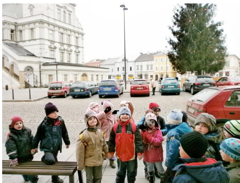
Vánoce v Uničově