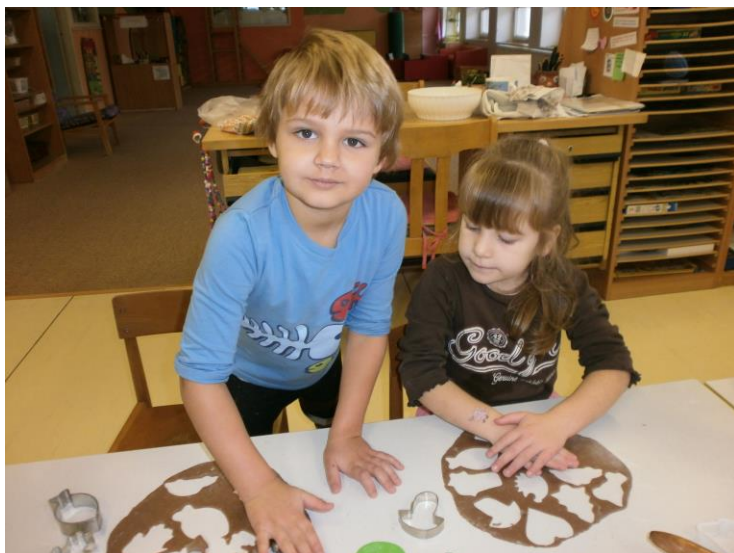
Pečení vánočních perníčků