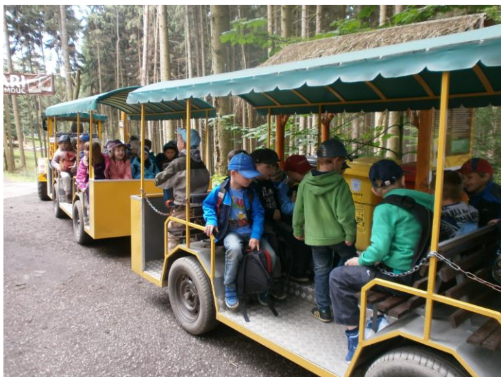
Výlet do ZOO