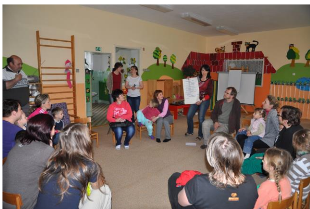
Setkání EKOškolek v MŠ Oskava