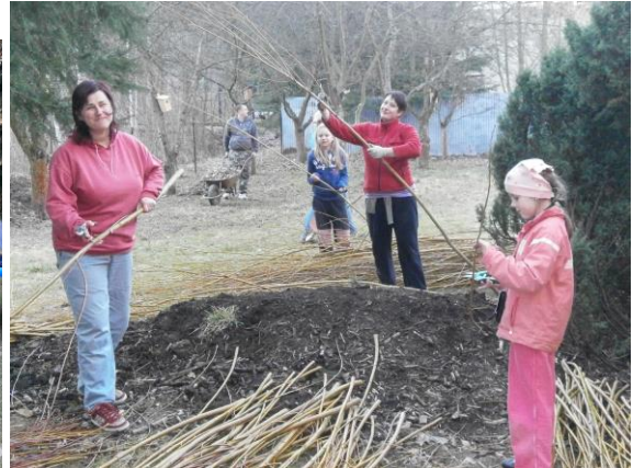
Brigády na školní zahradě