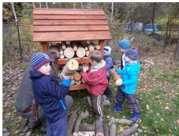
Výroba škvorovníků a hmyzích domečků ...