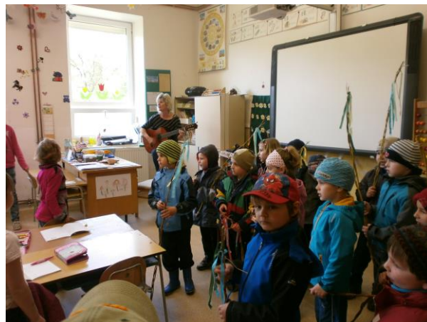
Děti při návštěvách v základní škole

V projektu Živá zahrada jsme navázali spolupráci s Gymnáziem Uničov. Využili jsme pozvání na promítání ve formátu 3D.