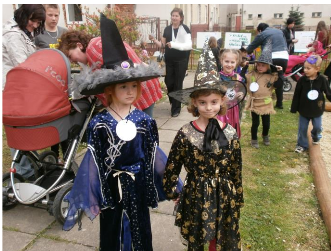
Čarodějnický rej ...