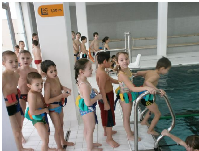
Plavecký bazén Uničov