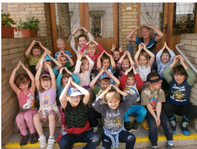
Spaní ve školce ...