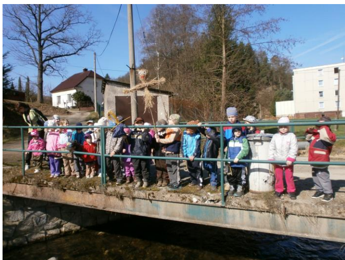
Vynášená Morany ...