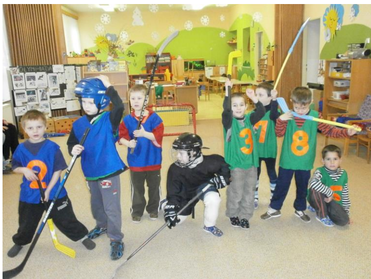
Hokejová zápas ...